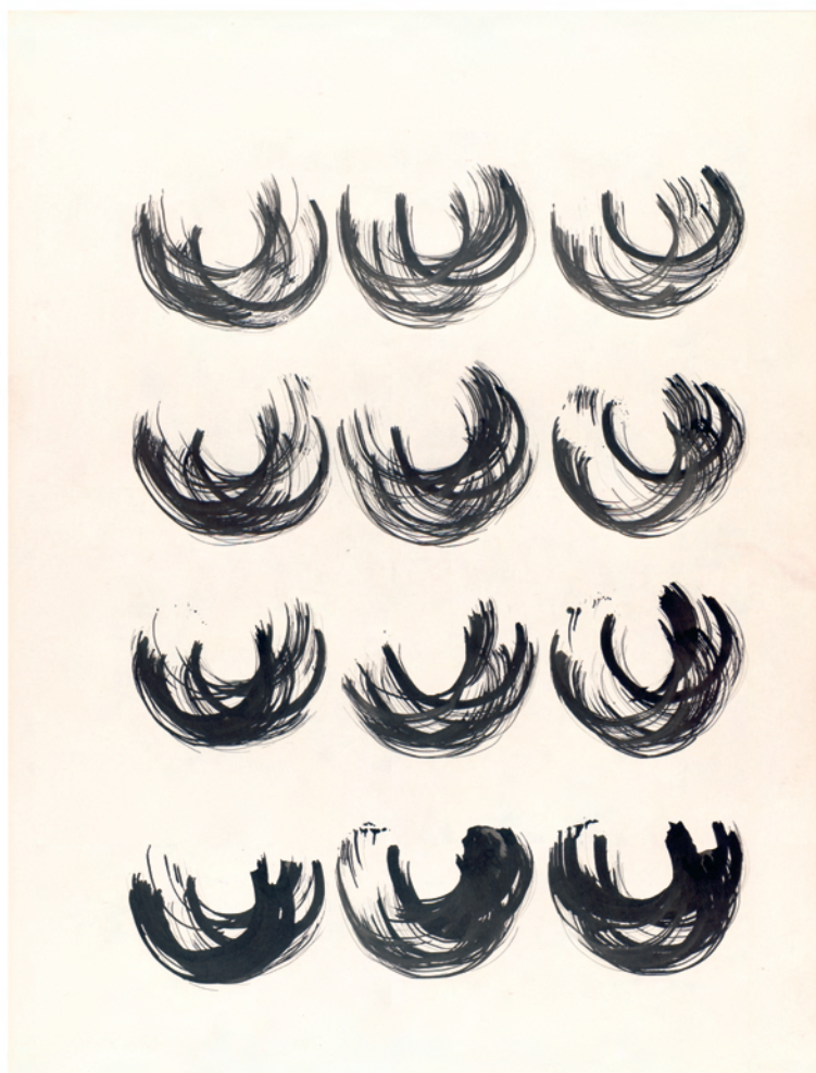
20.V.62 , Tusche auf Papier, 65,4 x 49,7 cm